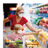
ショッピングモール